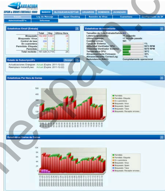
El Barracuda Spam & Virus Firewall filtra todos los mensajes de correo y muestra el número de correos electrónicos recibidos con estadísticas de como fueron procesados.

Sin software para instalar, ni modificaciones de red requeridas, el Barracuda Spam & Virus Firewall es fácil de instalar. La actualizaciones Energize son descargadas automáticamente por Barracuda Central, un centro de tecnología avanzado, donde ingenieros trabajan continuamente para proporcionar los métodos más efectivos para combatir las siempre cambiantes variantes de spam y virus. Las actualizaciones Energize, incluyendo las últimas definiciones de spam y virus y actualizaciones de seguridad, son distribuidas cada hora para protección continua contra las amenazas más recientes.