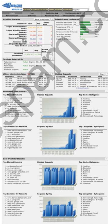
El Barracuda Web Filter monitorea atentados en cuando violación de políticas, descargas bloqueadas de Spyware y virus y clientes infectados.

Sin necesidad de instalar software ni hacerle modificaciones a la red, el Filtro Web Barracuda es fácil de montar. La Central Barracuda envía automáticamente las actualizaciones "Energize"; es un centro de tecnología avanzada donde trabajan ingenieros continuamente para proporcionar los métodos más efectivos para combatir todas las variantes, siempre cambiantes, de Spyware y virus. Las actualizaciones Energize, incluyendo las más recientes definiciones de anti-Spyware, definiciones de antivirus, categorías de filtro de contenido y actualizaciones de seguridad, son distribuidas cada hora para protección continua contra las amenazas más recientes.